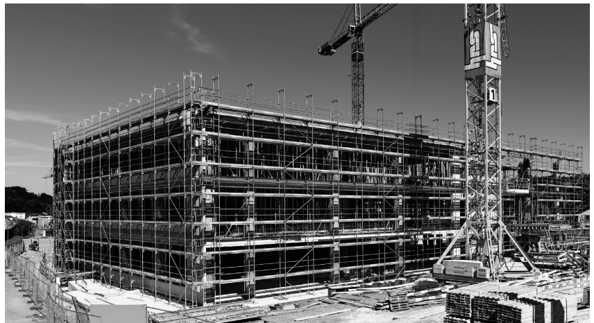
Erweiterungsbau in Flamatt: bezugsbereit im Spätsommer 2018

Die Bauarbeiten zur Erweiterung der Produktionskapazitäten in Flamatt verlaufen nach Plan. Der Neubau schafft dringend benötigten Raum für weiteres Wachstum und moderne Produktionsprozesse.