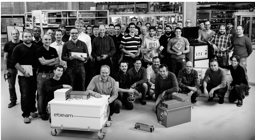
18 % aller Mitarbeitenden arbeiten im Bereich F&amp;E.

1435 Mitarbeiterinnen und Mitarbeiter aus mehr als 40 Nationen arbeiten bei der Comet Group: 66 % in Europa, 24 % in Nordamerika und 10 % in Asien.